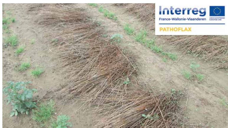
Rouissage du lin sur une parcelle d'essai

Pour plus d'informations : https://www.interreg-pathoflax.eu/?lang=fr • https://www.cra.wallonie.be/fr/pathoflax